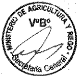
Milton von Hesse La Serna MINISTRO DE AGRICULTURA Y RIEGO